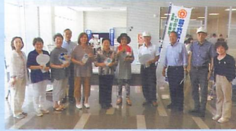
7月13日(土) 金沢港クルーズターミナル(金石分区)