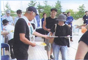
8月6日(火) 金沢市民野球場(南東分区)