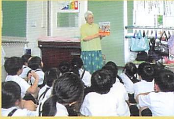
▲子ども達への読み聞かせ (三和小学校)