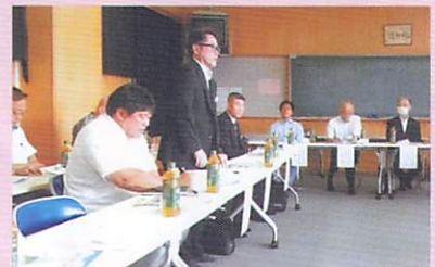
6月20日(木) 大徳中学校