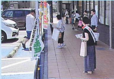
7月21日(日) アルビス西南部店前(南西分区)