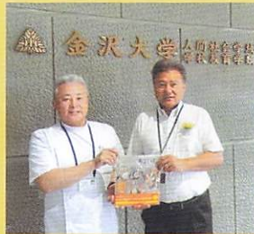
▲金沢大学附属小学校