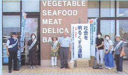
8月4日(日) アルビス高柳店前(北分区)