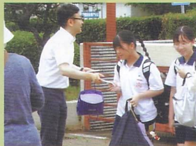
7月11日(木) 大徳中学校