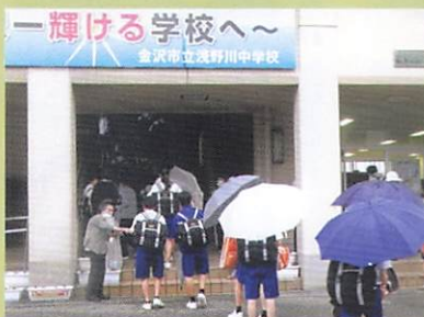
7月11日(木) 浅野川中学校