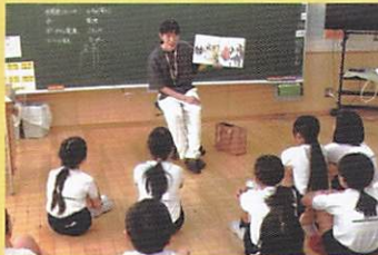
▲子ども達への読み聞かせ(中央小学校)