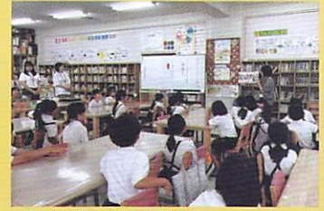
▲子ども達への読み聞かせ (木曳野小学校)

金沢保護区保護司会では、小学校との連携事業の一環として、今年も市内の全小学校に「あさいち」の絵本を寄贈しました。このほかに、小学校とは、標語の募集、あいさつ運動等の連携活動を行っています。