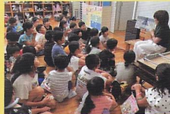
▲子ども達への読み聞かせ(夕日寺小学校)