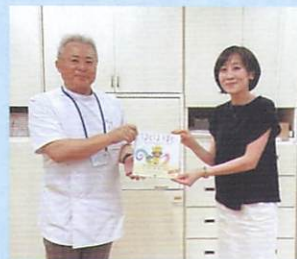
▲金沢大学附属中学校