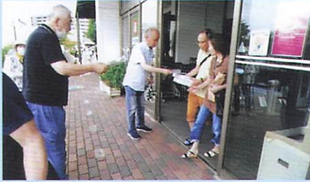
7月6日(土) イオンもりの里店前(東分区)