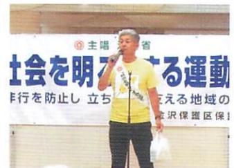
三角元金沢保護観察所長