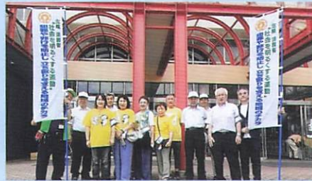
8月10日(土) アル・プラザ金沢前(西分区)